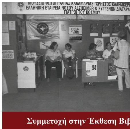
Συμμετοχή στην Έκθεση Βιβλίου