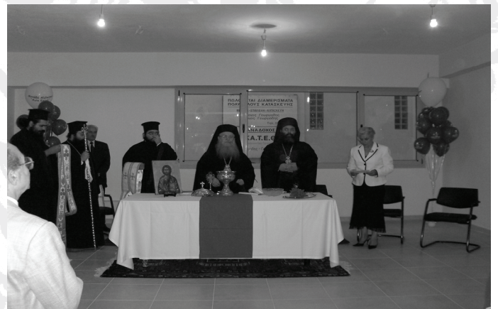
Εγκαίνια της Μονάδας Αντιμετώπισης νόσου Alzheimer