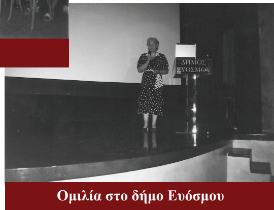
Ομιλία στο δήμο Ευόσμου