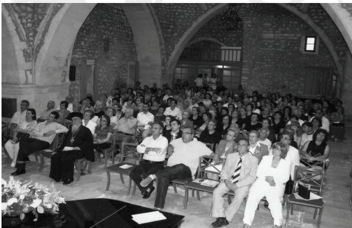
Ομιλία στην Εταιρεία του Ρεθύμνου