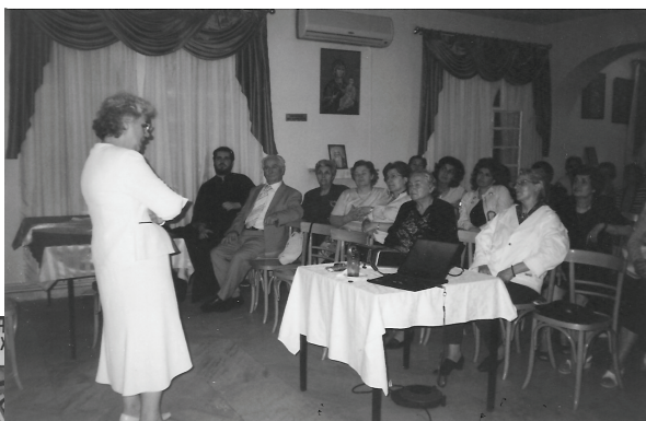
Ομιλία στην Οσία Ξένη