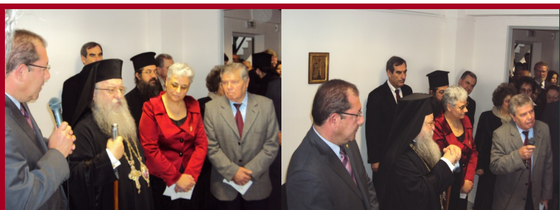
Στιγμιότυπα από τα εγκαίνια της νέας μονάδας

Η νέα Μονάδα Αντιμέτωπισης Προβλημάτων Νόσου Alzheimer "ΑΓΙΟΣ ΙΩΑΝΝΗΣ" στην οδό Κωνσταντίνου Καραμανλή 164