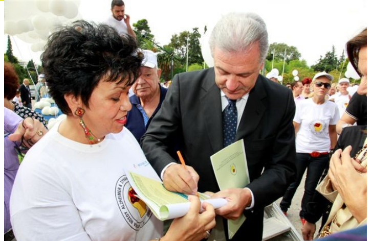
Η πρόεδρος της Εταιρείας Νόσου Alzheimer Αθηνών Δρ. Παρασκευή Σακκά και ο Υπουργός Υγείας, κ. Δημήτρης Αβραμόπουλος που υπογράφει την Πρωτοβουλία Δράσης για τη Νόσο Alzheimer.

Ακολούθησε η βράβευση των νικητών του Παιδικού Διαγωνισμού Ζωγραφικής με θέμα: Πράγματα που κάνω με τον παππού και τη γιαγιά. Ο φεινός απολογισμός του εορτασμού της Παγκόσμιας Ημέρας Alzheimer μας γέμισε αισιοδοξία. Η αναπόκριση του κόσμου ήταν μεγαλύτερη από κάθε άλλη χρονιά! Το γεγονός αυτό μας δίνει την πεποίθηση ότι με συντονισμένες προσπάθειες η Πολιτεία, οι επαγγελματίες υγείας, οι Εταιρείες Alzheimer, οι ασθενείς και οι περιθάλποντές τους μπορούμε να αντιμετωπίσουμε αποτελεσματικά τη νόσο.