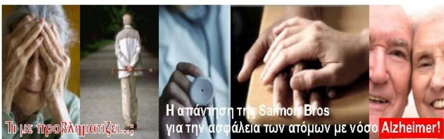
Τι με προβληματίζει...;

" Έχω Alzheimer. Αλλά συνεχίζω να ζω με χαμόγελο διευκολύνοντας εμένα και την οικογένειά μου. "