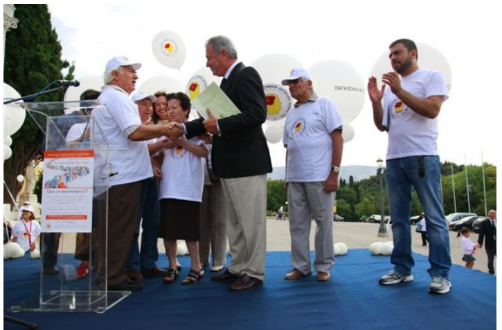
Μέλη της Εταιρείας Νόσου Alzheimer και Συναφών Διαταραχών Αθηνών παραδίδουν στον Υπουργό Υγείας κ. Δημήτρη Αβραμόπουλο τις 10.000 υπογραφές που συγκεντρώσαμε.