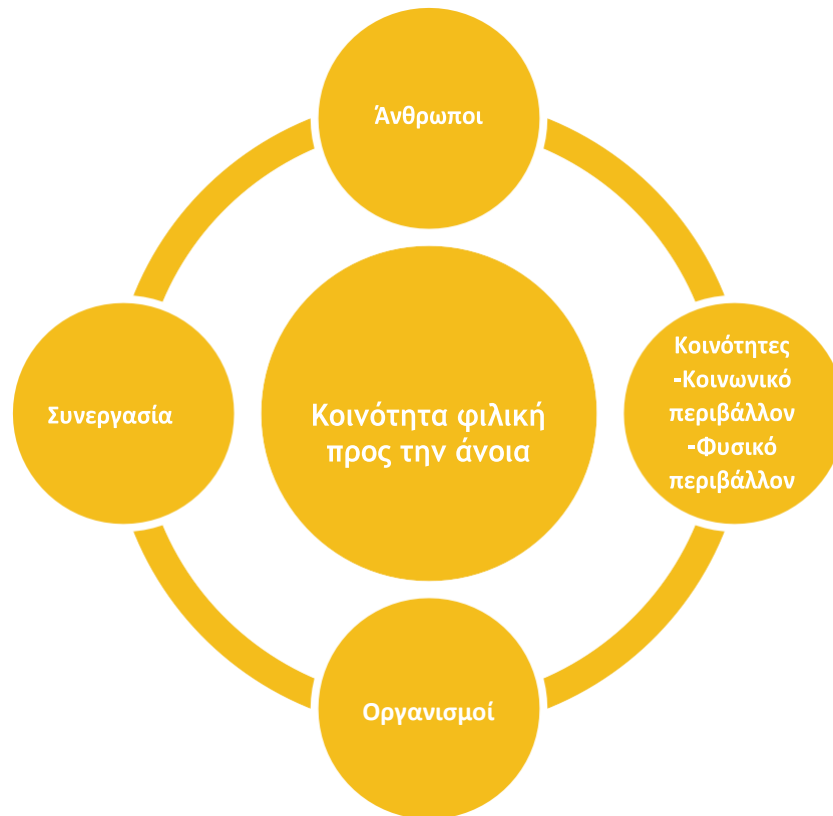
Γραφική αναπαράσταση 1: Τα τέσσερα βασικά στοιχεία που χρειάζονται για μια κοινότητα φιλική προς την άνοια

Η Alzheimer's Disease International (ADI) προτείνει τέσσερα βασικά στοιχεία για να υποστηριχθεί μια κοινότητα φιλική προς την άνοια. Αυτά είναι οι άνθρωποι, οι κοινότητες, οι οργανισμοί και οι συνεργασίες.